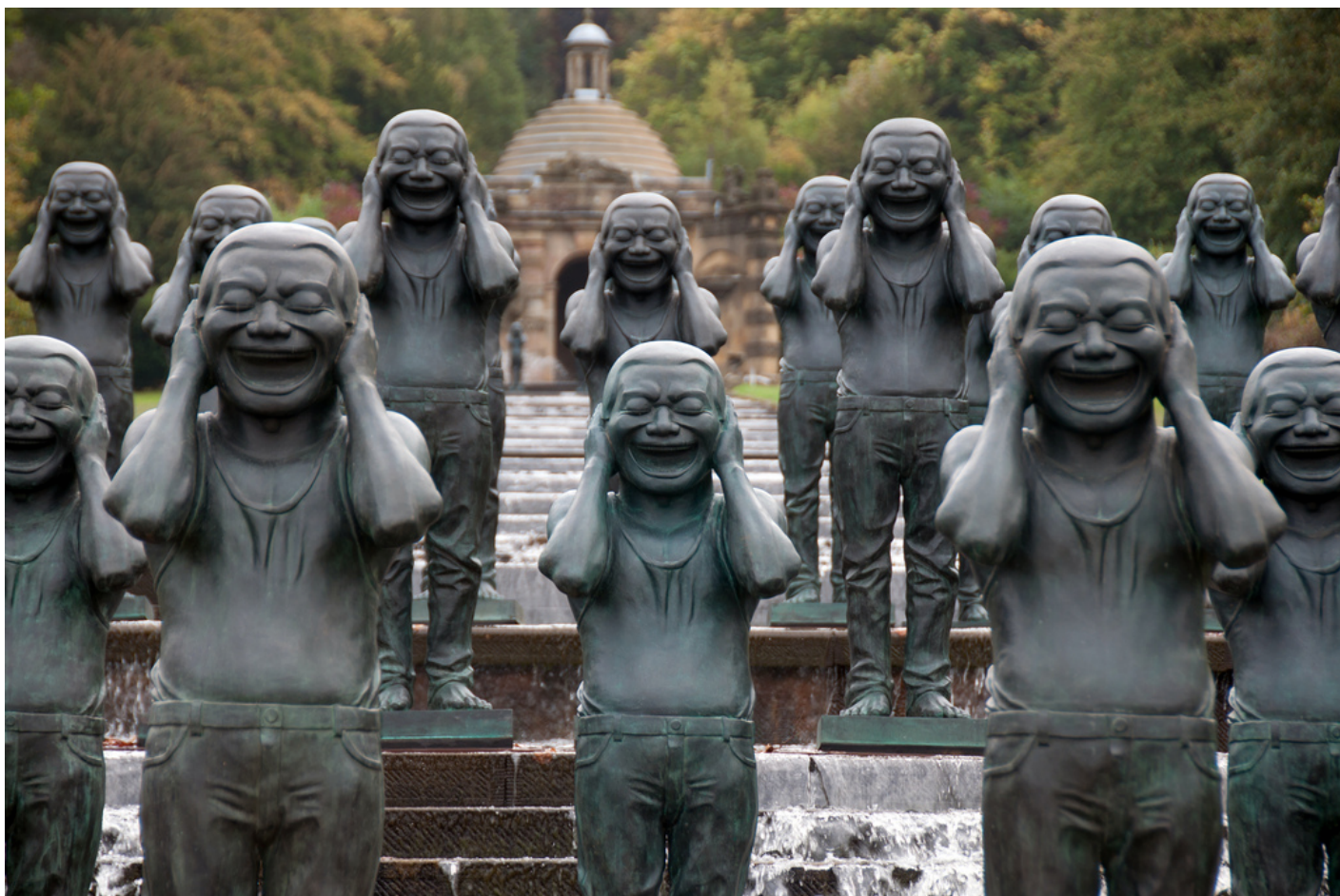
Terracotta Warriors (Contemporary) - Yue Minjun