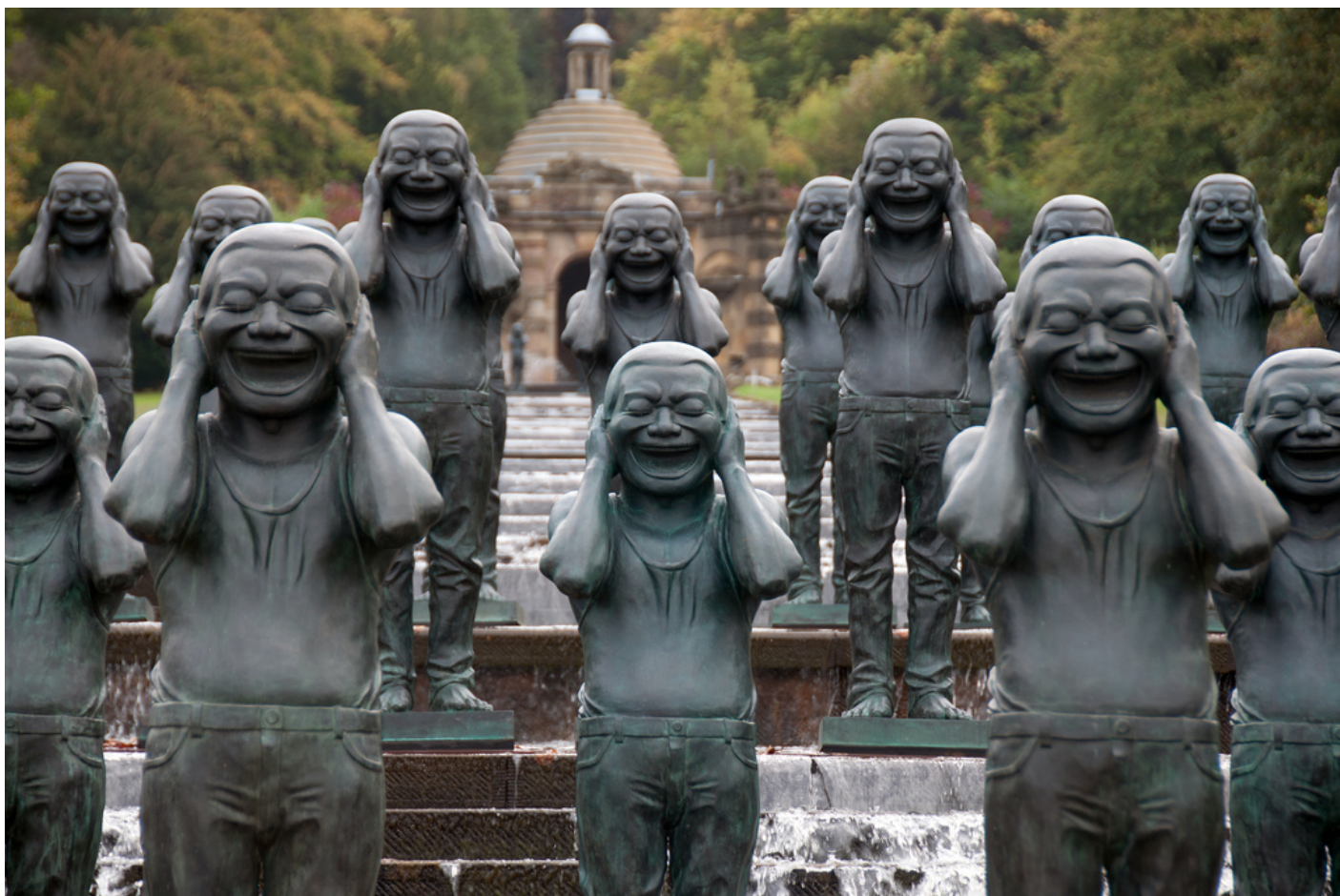
Terracotta Warriors (Contemporary) - Yue Minjun