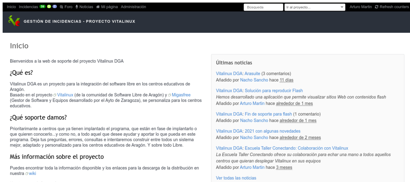
imagen 3.4.1 - Web de Soporte del Programa Vitalinux

Con la finalidad de dar soporte técnico a todos los centros educativos de la Comunidad Autónoma de Aragón que hacen uso de Vitalinux existe una web donde previo registro un usuario puede solicitar ayuda y asesoramiento sobre cualquier aspecto concerniente a Vitalinux : Web de soporte