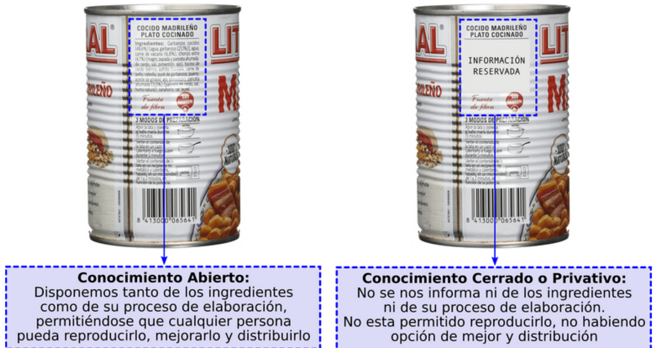
image 2.2.1 - Comparación entre conocimiento abierto y cerrado

La mejor forma de comprender qué es el conocimiento libre y sus beneficios es compararlo con el conocimiento cerrado o privativo. Para ello, a modo de ejemplo, se muestran dos productos aparentemente iguales pero que difieren en la información que aportan: abierto y cerrado .