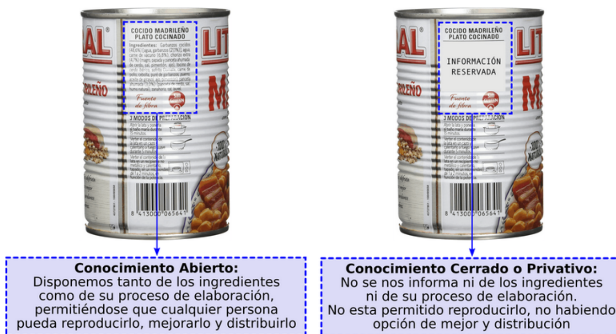
image 2.2.1 - Comparación entre conocimiento abierto y cerrado

La mejor forma de comprender qué es el conocimiento libre y sus beneficios es compararlo con el conocimiento cerrado o privativo. Para ello, a modo de ejemplo, se muestran dos productos aparentemente iguales pero que difieren en la información que aportan: abierto y cerrado .