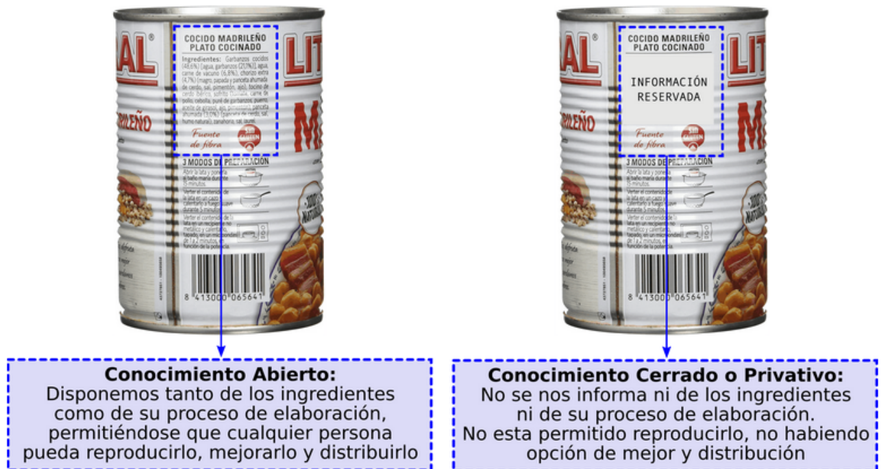
image 2.2.1 - Comparación entre conocimiento abierto y cerrado

La mejor forma de comprender qué es el conocimiento libre y sus beneficios es compararlo con el conocimiento cerrado o privativo. Para ello, a modo de ejemplo, se muestran dos productos aparentemente iguales pero que difieren en la información que aportan: abierta y cerrada .