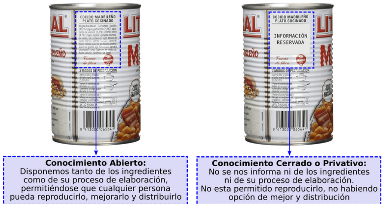
image 2.2.1 - Comparación entre conocimiento abierto y cerrado

La mejor forma de comprender qué es el conocimiento libre y sus beneficios es compararlo con el conocimiento cerrado o privativo. Para ello, a modo de ejemplo, se muestran dos productos aparentemente iguales pero que difieren en la información que aportan: abierto y cerrado .