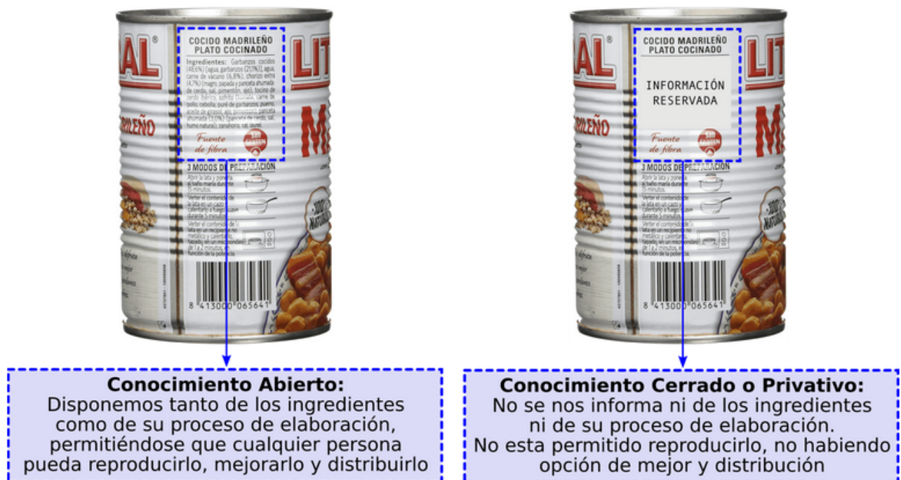
image 2.2.1 - Comparación entre conocimiento abierto y cerrado

La mejor forma de comprender qué es el conocimiento libre y sus beneficios es compararlo con el conocimiento cerrado o privativo. Para ello, a modo de ejemplo, se muestran dos productos aparentemente iguales pero que difieren en la información que aportan: abierto y cerrado .