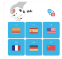
Tarjeta de configuración de idioma y de longitud del paso de movimiento del robot (doble cara)

Además de estos elementos básicos, existen otros materiales que pueden ser añadidos para complementar el uso del robot, hablaremos de ellos más adelante pero destacamos la activity box y el kit de tarjetas magnéticas de tale bot .