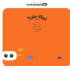
Guía de usuario