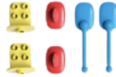
2 alerones, 2 soportes para dibujar y 2 brazos