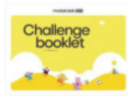
Cuaderno de retos