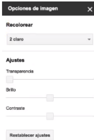
Imagen - Opciones de edición de la imagen

Clica sobre la imagen y accede a más herramientas de gran utilidad. Echa un ojo a la imagen de la derecha.