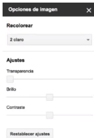
Imagen - Opciones de edición de la imagen

Clica sobre la imagen y accede a más herramientas de gran utilidad. Echa un ojo a la imagen de la derecha.