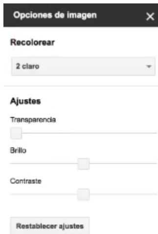
Imagen - Opciones de edición de la imagen

Clica sobre la imagen y accede a más herramientas de gran utilidad. Echa un ojo a la imagen de la derecha.