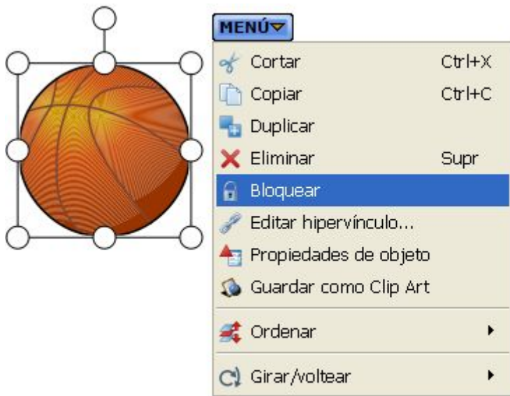
Fig.2.21. Captura del programa

la alineación, las características o el color del texto (como vimos en el tutorial inicial).