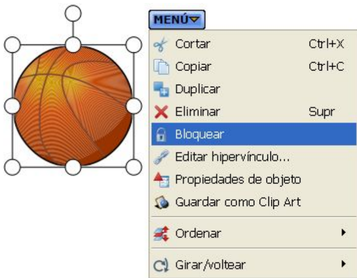
Fig.2.21. Captura del programa

En la barra contextual de opciones de la parte inferior, podemos modificar la fuente, el tamaño, la alineación, las características o el color del texto (como vimos en el tutorial inicial).